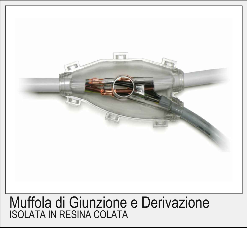
Muffola di Giunzione e Derivazione ISOLATA IN RESINA COLATA